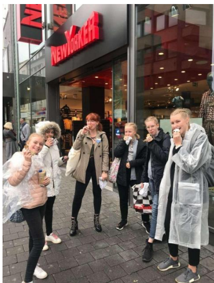
Från vår första resa till Olpe, 2019

Detta är den första sidan skapad av föreningens barn och ungdomar, men förhoppningsvis inte den sista! En sida med innehåll från de yngre är tänkt att vara med i även de kommande tidningarna. Det första vi vill göra är att berätta vad vi tycker är det bästa med dansen!