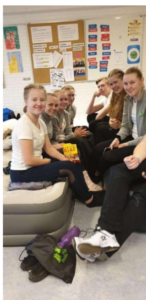
Dansfestival i Danmark, 2020

Det bästa med att dansa är gemenskapen som finns både inom ungdomsgruppen men även inom hela föreningen. Man känner sig alltid välkommen och uppskattad för den man är. Tack vare den gemenskap vi har i gruppen blir det ännu roligare att åka på resor tillsammans. Det är kul att både få träffa vänner från andra länder som vi lärt känna under åren vi dansat men inte minst att få lära sig danser från andra länder.