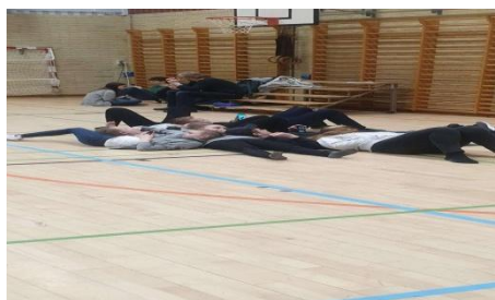
Taktikvila är viktigt

Det bästa med att dansa är gemenskapen som finns både inom ungdomsgruppen men även inom hela föreningen. Man känner sig alltid välkommen och uppskattad för den man är. Tack vare den gemenskap vi har i gruppen blir det ännu roligare att åka på resor tillsammans. Det är kul att både få träffa vänner från andra länder som vi lärt känna under åren vi dansat men inte minst att få lära sig danser från andra länder.