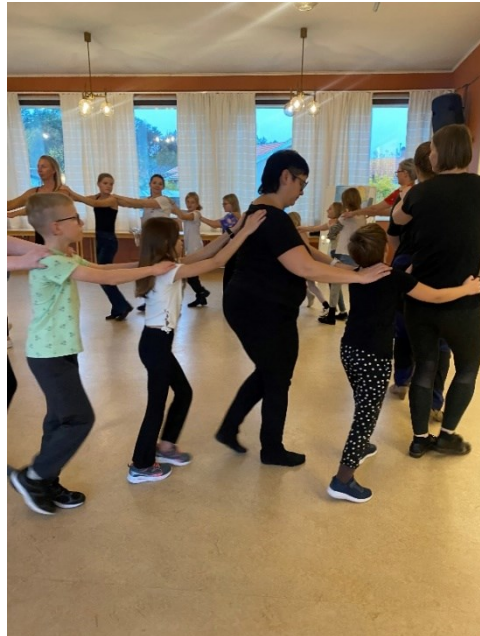
Massor med roliga lekar, några hade vi lekt tidigare och några var helt nya