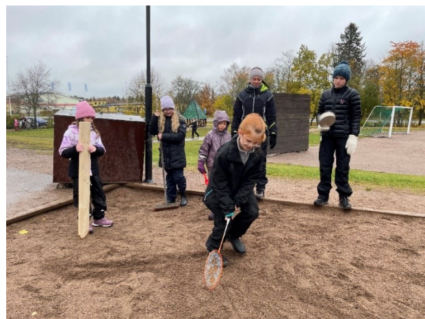
Bäst-i-test-lekarna var skoj!