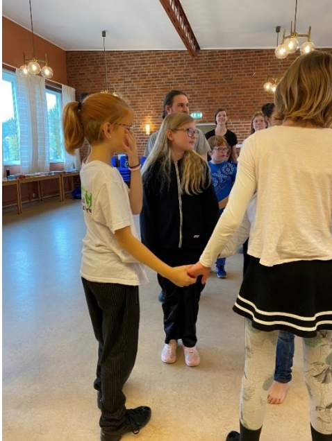
Kul att lära känna andra och få dansa deras favoritdanser

Tåget tog oss till Linköping och där hämtades vi av trogna chaufförer som körde oss till härliga Landerydgården! Så roligt att träffa andra som dansar! Många av dom kände vi igen från tidigare läger!